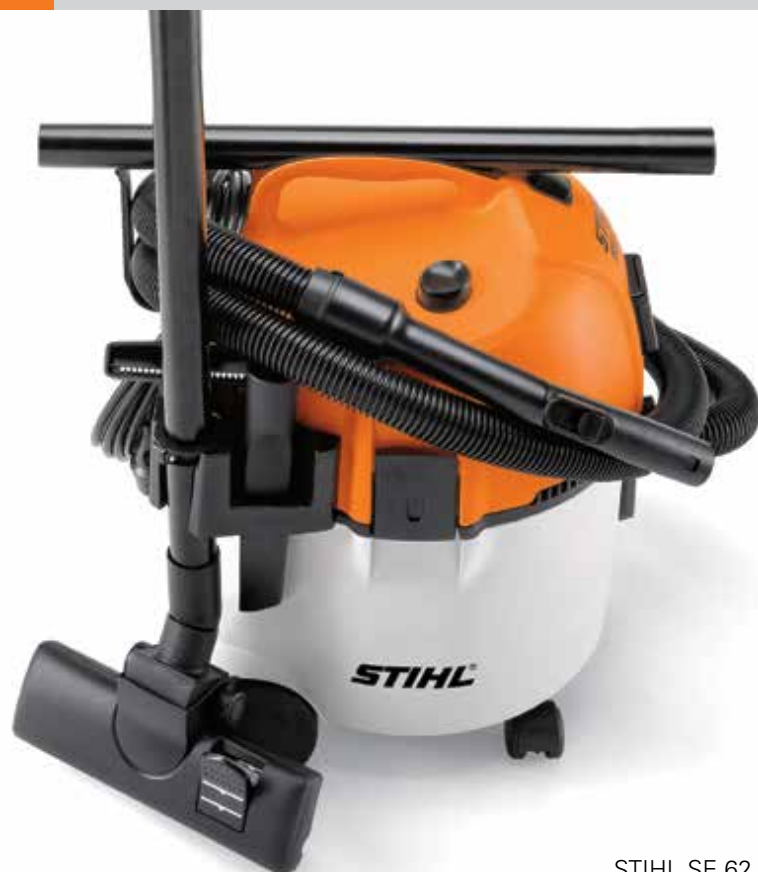
STIHL SE 62