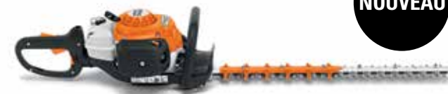
HS 82 R

Cet outil professionnel remplace le HS 81, mais avec les dernières avancées technologiques de STIHL. Équipé d'un moteur à balayage stratifié qui réduit de 20 % la consommation de carburant et qui répond aux normes en matière d'émissions polluantes, d'un filtre à air longue durée pour une protection accrue du moteur, de lames à double tranchant pour une coupe de grande qualité, d'une poignée multifonction ajustable et d'un bouchon de réservoir d'essence sans outil. Ce taille-haie est un produit innovateur qui a été conçu en fonction du professionnel exigeant.