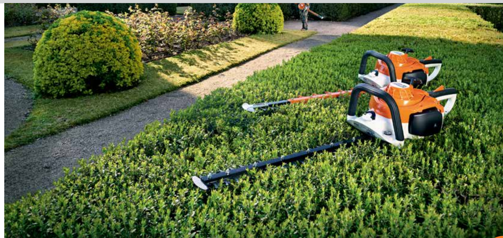
Tableau récapitulatif : taille-haies et taille-haies à longue portée