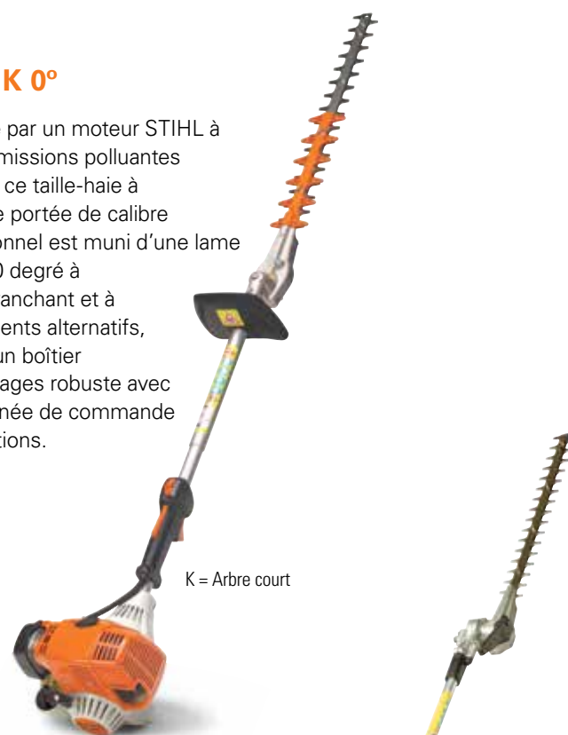
K = Arbre court

Alimenté par un moteur STIHL à faibles émissions polluantes éprouvé, ce taille-haie à moyenne portée de calibre professionnel est muni d'une lame droite à 0 degré à double tranchant et à mouvements alternatifs, ainsi qu'un boîtier d'engrenages robuste avec une poignée de commande antivibrations.