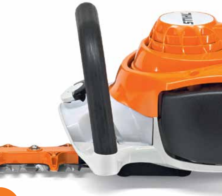
STIHL HS 56 C-E