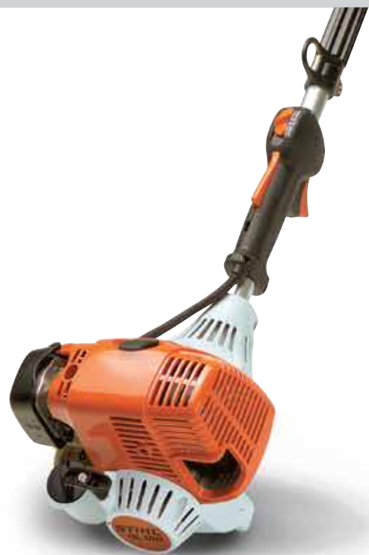
STIHL HL 100 0-135°