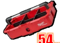
PLATEAU OUTILS DIVISEURS MIL48228045