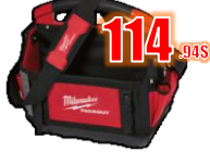
SAC À OUTILS 15" MIL48228315