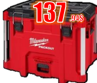
COFFRE XL 100 LB MIL48228429