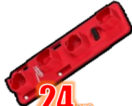
SUPPORT M12 BATTERIES MIL48228338