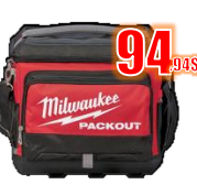
GLACIÈRE PACKOUT MIL48228302