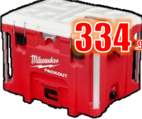
GLACIÈRE 10 G PACKOUT MIL48228462