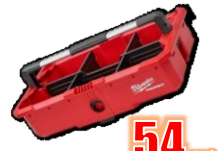
PLATEAU OUTILS DIVISEURS MIL48228045