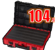
COFFRE MOYEN + MOUSSE OUTILS MIL48228450