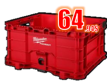
COFFRE PACKOUT 50 Lb / 16x13x9" MIL48228440