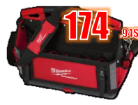
SAC À OUTILS 20" MIL48228320