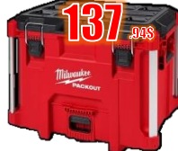
COFFRE XL 100 LB MIL48228429