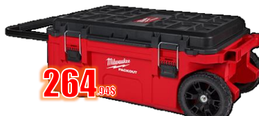
GROS COFFRE 250 LB, ROULETTES MIL48228428