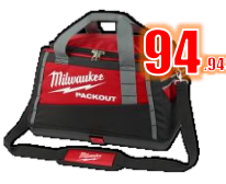
SAC À OUTILS 20" PACKOUT MIL48228322