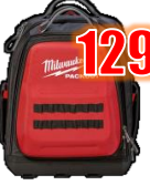
SAC À DOS PACKOUT MIL48228301