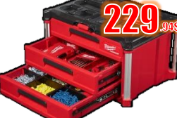
COFFRE 3 TIROIRS PACKOUT MIL48228443