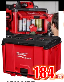
ARMOIRE 50 Lb MIL48228445