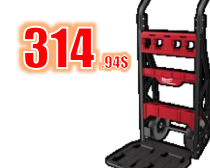
CHARIOT 2 ROUES CAP. 400 LBS MIL48228415