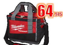
SAC À OUTILS 15" PACKOUT MIL48228321