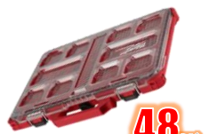
ORGANISATEUR JOINTS COTES IP65 MIL48228431