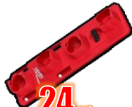
SUPPORT M12 BATTERIES MIL48228338