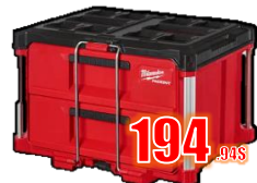
COFFRE 2 TIROIRS PACKOUT MIL48228442