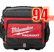
GLACIÈRE PACKOUT MIL48228302