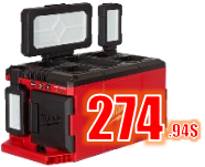
LUMIERE CHARG. 3000 LUM M18 MIL235720