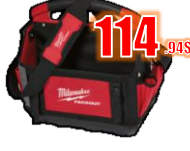
SAC À OUTILS 15" MIL48228315