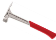
54,94$ Marteau cadrage à face usinée 482 g (17 oz) MIL48-22-9016