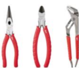
54,94$ Ensemble de 3 pinces Acier forgé Résiste rouille MIL48-22-6331