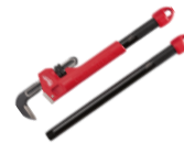
134,94$ Clé à tube adaptable 18 - 24 po MIL48-22-7314