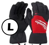
28,94$ Gants d'hiver Jointure SMARTSWIPE 4MIL48-73-0032