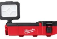
PROJECTEUR 1400 LUM, USB MIL2356-20