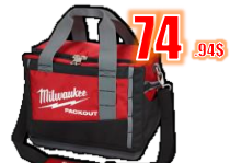
SAC À OUTILS 15" PACKOUT MIL48228321