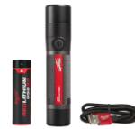
94,94$ Lampe de rechargeable 800 L, USB TRUEVIEW MIL2160-21