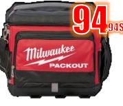
BOITE A LUNCH MIL48228302