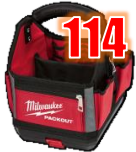
SAC À OUTILS 10" MIL48228310