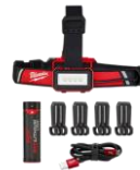
74,94$ Lampe frontale à profil bas REDLITHIUM USB, 600 lumens 4MIL211521