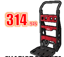
CHARIOT 2 ROUES CAP. 400 LBS MIL48228415