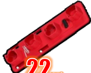
SUPPORT M12 BATTERIES MIL48228338