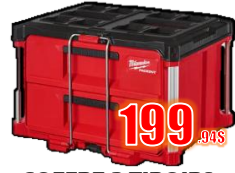
COFFRE 2 TIROIRS PACKOUT MIL48228442