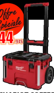
CHARIOT COFFRE 250 Lb MIL48228426