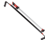
244,94$ Lampe de mécanicien M12, DEL 1 350 lumens, MIL2125-20