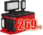
LUMIERE CHARG. 3000 LUM M18 MIL235720