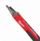
22,94$ Détecteur de tension avec DEL CAT IV 1000 V MIL2202-20