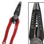
44,94$ Pince combinée 7-en-1, poignée de force MIL48-22-3078