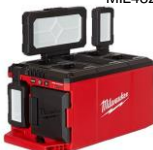
PROJECTEUR 3000 LUM MIL2357-20