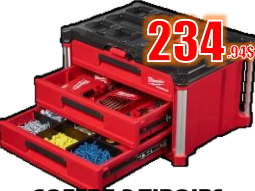
COFFRE 3 TIROIRS PACKOUT MIL48228443