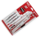
29,94$ Lames démolition SAWZALL bois et métal, 12 PC MIL49-22-3329