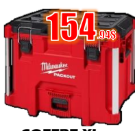
COFFRE XL 100 LB MIL48228429