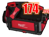
SAC À OUTILS 20" MIL48228320