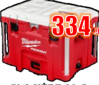
GLACIÈRE 10 G PACKOUT MIL48228462