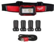
79,94$ Lampe frontale Aimantée, 450 Lum, Rechargeable, éclairage direct MIL2012R