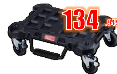
CHARIOT PACKOUT 250 Lb MIL48228410