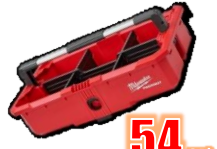
PLATEAU OUTILS DIVISEURS MIL48228045