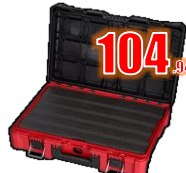
COFFRE MOYEN + MOUSSE OUTILS MIL48228450