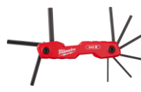
24,94$ Jeu de 9 clés hexagonales pliantes - SAE MIL48-22-2181