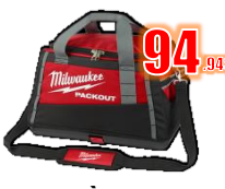
SAC À OUTILS 20" PACKOUT MIL48228322