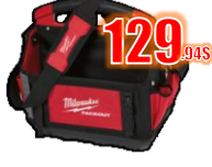
SAC À OUTILS 15" MIL48228315