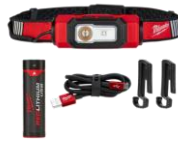
114,94$ Lampe de casque de protection rechargeable USB BEACON, 600 lumens 4MIL211621