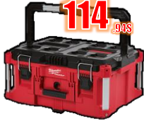
GRAND COFFRE 100 Lb MIL48228425