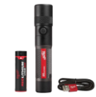
104,94$ Lampe de poche rechargeable USB 1100L, TRUEVIEW MIL2161-21