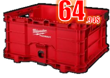
COFFRE PACKOUT 50 Lb / 16x13x9" MIL48228440