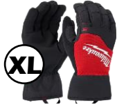
28,94$ Gants d'hiver Jointure SMARTSWIPE 4MIL48-73-0033