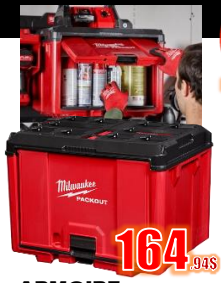
ARMOIRE 50 Lb 4MIL48228445