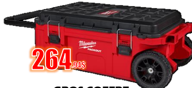
GROS COFFRE 250 LB, ROULETTES 4MIL48228428