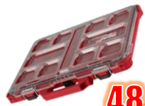
ORGANISATEUR JOINTS COTES IP65 MIL48228431