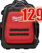
SAC À DOS PACKOUT MIL48228301