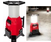
764,94$ Lampe chantier /chargeur M18 RADIUS, ONEKEY 9 000 lumens MIL2150-20