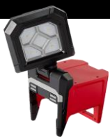
144,94$ Projecteur d'illumination montable M18 ROVER, 1500 lumens 4MIL2365-20