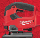
Scie sauteuse à poignée en D M18 FUEL MC (outil seulement) (2737-20)