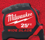
Ruban à mesurer Wide Blade de 25 pi (48-22-0225)