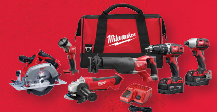
Ensemble de 6 outils sans fil M18 MC (2696-26)