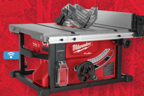
Scie circulaire à table M18 FUEL MC de 8 1/4 po avec ONE-KEY MC (2736-20)