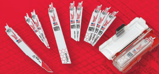
Ensemble de 12 lames de démolition (49-22-3329)