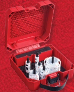
Ensemble de scie-cloche à dents au carbure HOLE DOZER MC (15 pièces) (49-22-3097)