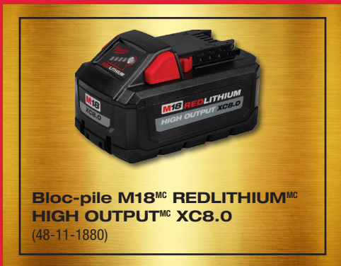
Bloc-pile M18 MC REDLITHIUM MC HIGH OUTPUT MC XC8.0 (48-11-1880)