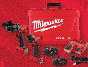
Ensemble de 2 outils M18 FUEL MC (3697-22)