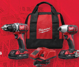
Ensemble de 2 outils sans fil M18 MC au LITHIUM-ION (2691-22)