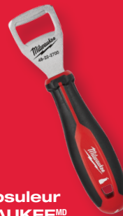
Décapsuleur MILWAUKEE MD (48-22-2700)