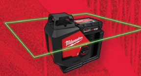
Niveau laser à faisceau vert à plan unique 360° M12 MC (3631-20) (3631-21) (ensemble)