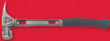
Marteau à face de frappe fraisée et à manche courbé Stiletto MD Tibone 3 (TB3MC)