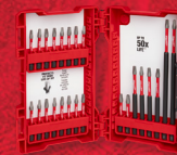
Ensemble de 24 embouts SHOCKWAVE IMPACT DUTY MC (48-32-4019)