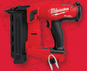
Cloueuse pour petits clous de finition de calibre 18 M18 FUEL MC (outil seulement) (2746-20)