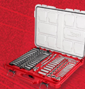
Ensemble de douilles et de clés à cliquet à prise de 3/8 po et 1/4 po SAE/métriques PACKOUT MC pour mécanicien (106 pièces) (48-22-9486)