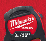
Ruban à mesurer STUD MC de 8 m/26 pi (48-22-9726)