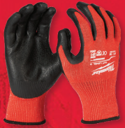
Gants enduits de nitrile, résistance aux coupures de niveau 3 (48-22-8931)