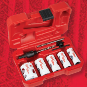
Ensemble de scie-cloche HOLE DOZER MC à usage général (9 pièces) (49-22-4006)