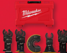
Ensemble de 8 lames variées OPEN-LOK MC (48-90-9212)