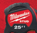
Ruban à mesurer STUD MC de 25 pi (48-22-9725)