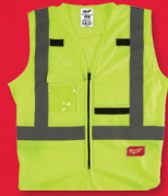
Gilets de sécurité à haute visibilité de classe 2 (48-73-5061)