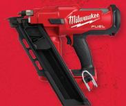
Cloueuse à charpente M18 FUEL MC à 30 degrés (outil seulement) (2745-20)