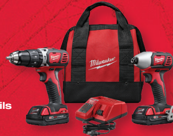
Ensemble de 2 outils sans fil M18 MC au LITHIUM-ION (2697-22CT)