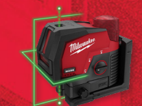
Niveau laser à faisceau vert en croix avec points d'aplomb M12 MC (3622-20) (3622-21) (ensemble)