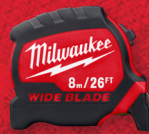
Ruban à mesurer Wide Blade de 8 m/26 pi (48-22-0226)