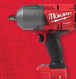
Clé à chocs à couple élevé de 1/2 po M18 FUEL MC avec anneau de friction (outil seulement) (2767-20)