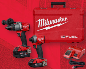
Visseuse à percussion et perceuse à percussion de nouvelle génération M18 FUEL MC (3697-22CX)