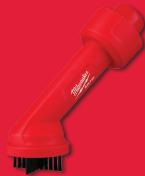
Brosse en croix AIR-TIP MC (49-90-2035)