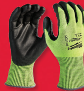
Gants enduits de polyuréthane à haute visibilité, résistance aux coupures de niveau 4 (48-73-8942)