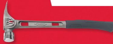
Marteau à face de frappe lisse et à manche courbé Stiletto MD Tibone 3 (TB3SC)