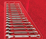
Ensemble combiné de 15 clés de mécanicien SAE (48-22-9415)