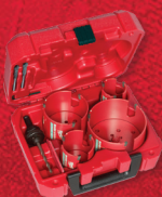
Ensemble de scie-cloche à dents au carbure BIG HAWG MC (8 pièces) (49-56-9285)