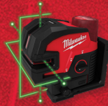
Niveau laser à faisceau vert en croix et 4 points d'aplomb M12 MC (3624-20) (3624-21) (ensemble)