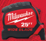
Ruban à mesurer Wide Blade de 25 pi (48-22-0225)