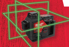
Ensemble de niveau laser à faisceau vert à 3 plans 360° M12 MC (3632-21)