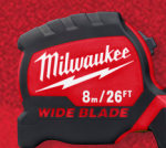
Ruban à mesurer Wide Blade de 8 m/26 pi (48-22-0226)