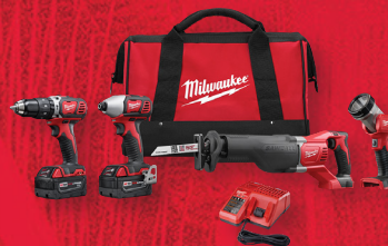
Ensemble de 4 outils sans fil M18 MC au LITHIUM-ION (2696-24)